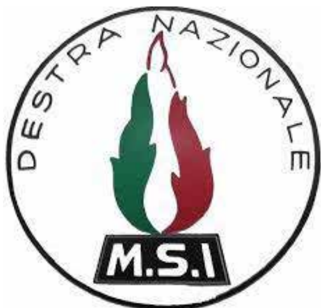
Znak Movimento Sociale Italiano, postfašistické organizace založené bývalými spolupracovníky samotného Benita Mussoliniho.