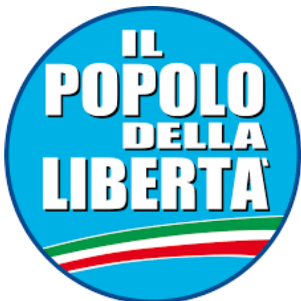
Znak Berlusconiho strany Il Popolo della Libertà, ve kterém Silvio Berlusconi sjednotil italskou pravici a dal jí silně populistický ráz