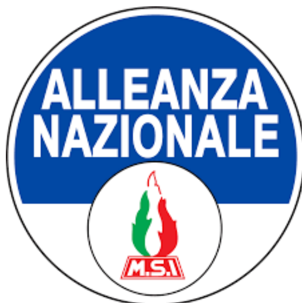
Znak strany Alleanza nazionale, kterou založil Gianfranco Fini, aby poněkud oslabil negativní postfašistické konotace tohoto pravicového uskupení