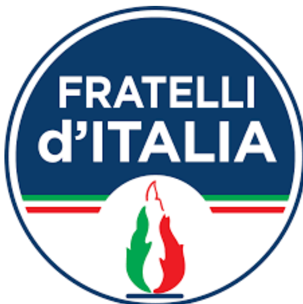
Znak strany Fratelli d'Italia, kterou spoluzaložila sama Giorgia Meloni, která je v současné době i její předsedkyní – do loga se opět vrátila Fiamma Tricolore.